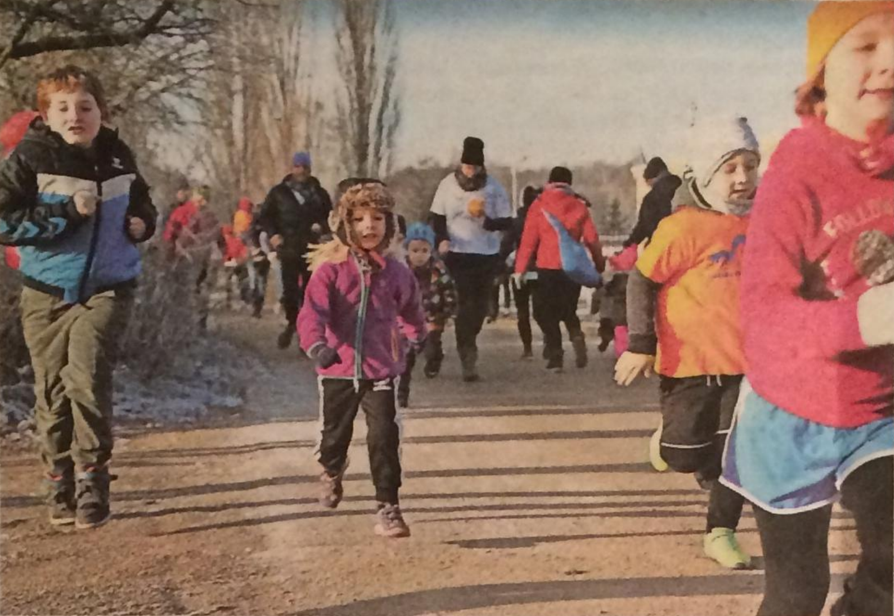
Wer noch am Bambini-Lauf teilnehmen möchte, sollte sich schnell noch online anmelden.